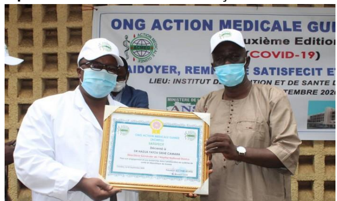
Satisfécit de Mme la Directrice Générale de l'Hôpital National Donka